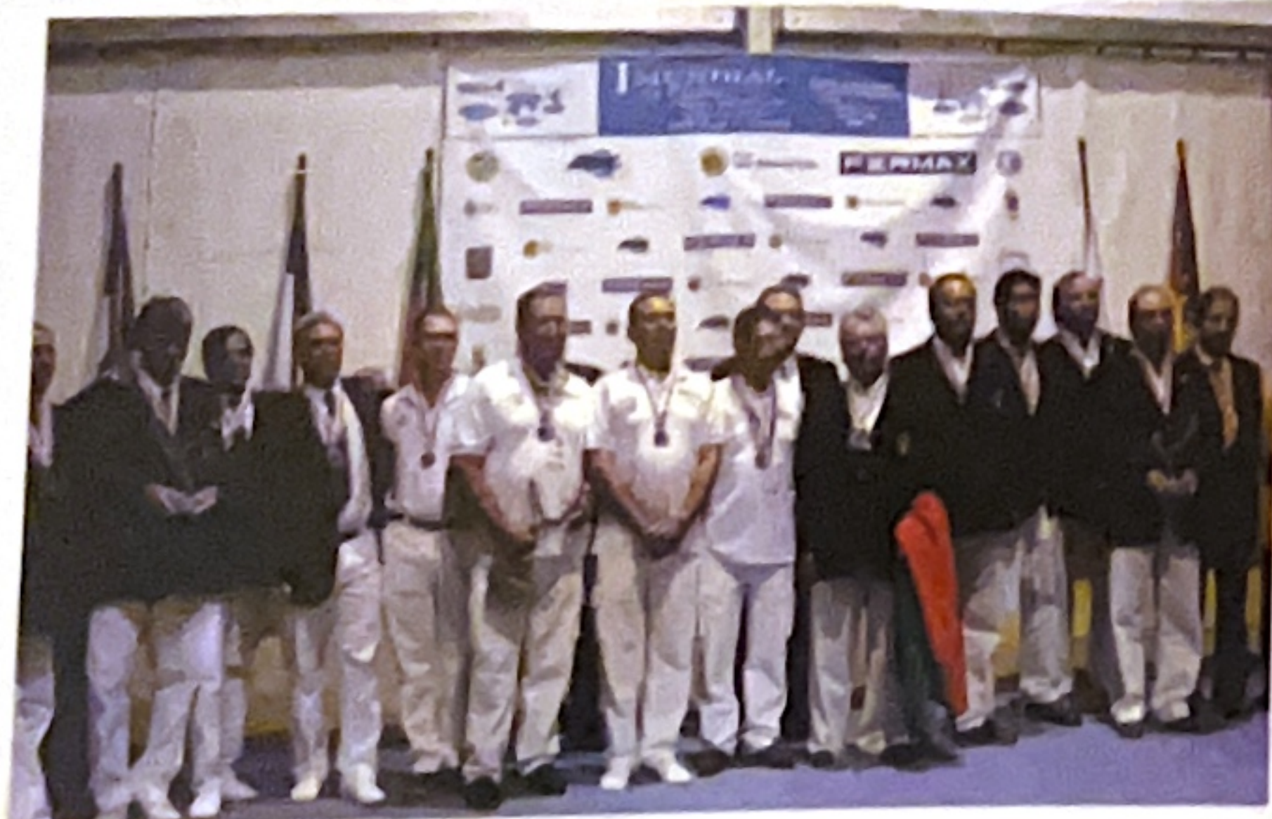
Los tres equipos ganadores.