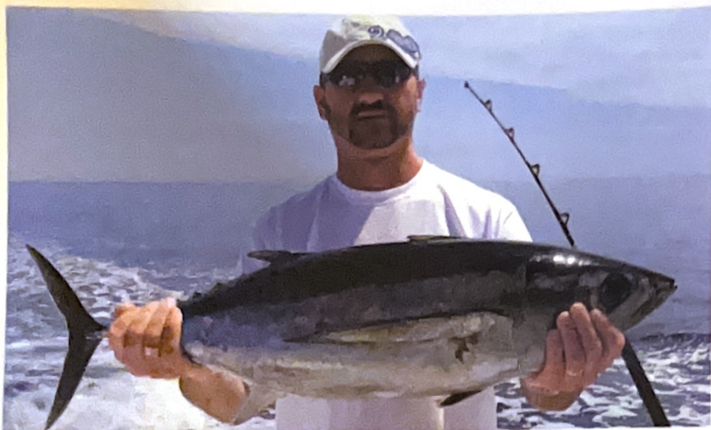
Albacora capturada por el Club Náutico Arenys de Mar.

Club Mar Sport Arenys de Mar (España B), con una lampuga de 6,8 kg y una albacora de 11,3 kg, seguido de "Le thon club de le gran bouche" (Francia B) con una preciosa albacora de 16,4 kg. El primer día de pesca se le dio relativamente bien a todos los equipos, menos a tres, dos italianos y uno francés, que no tuvieron suerte.