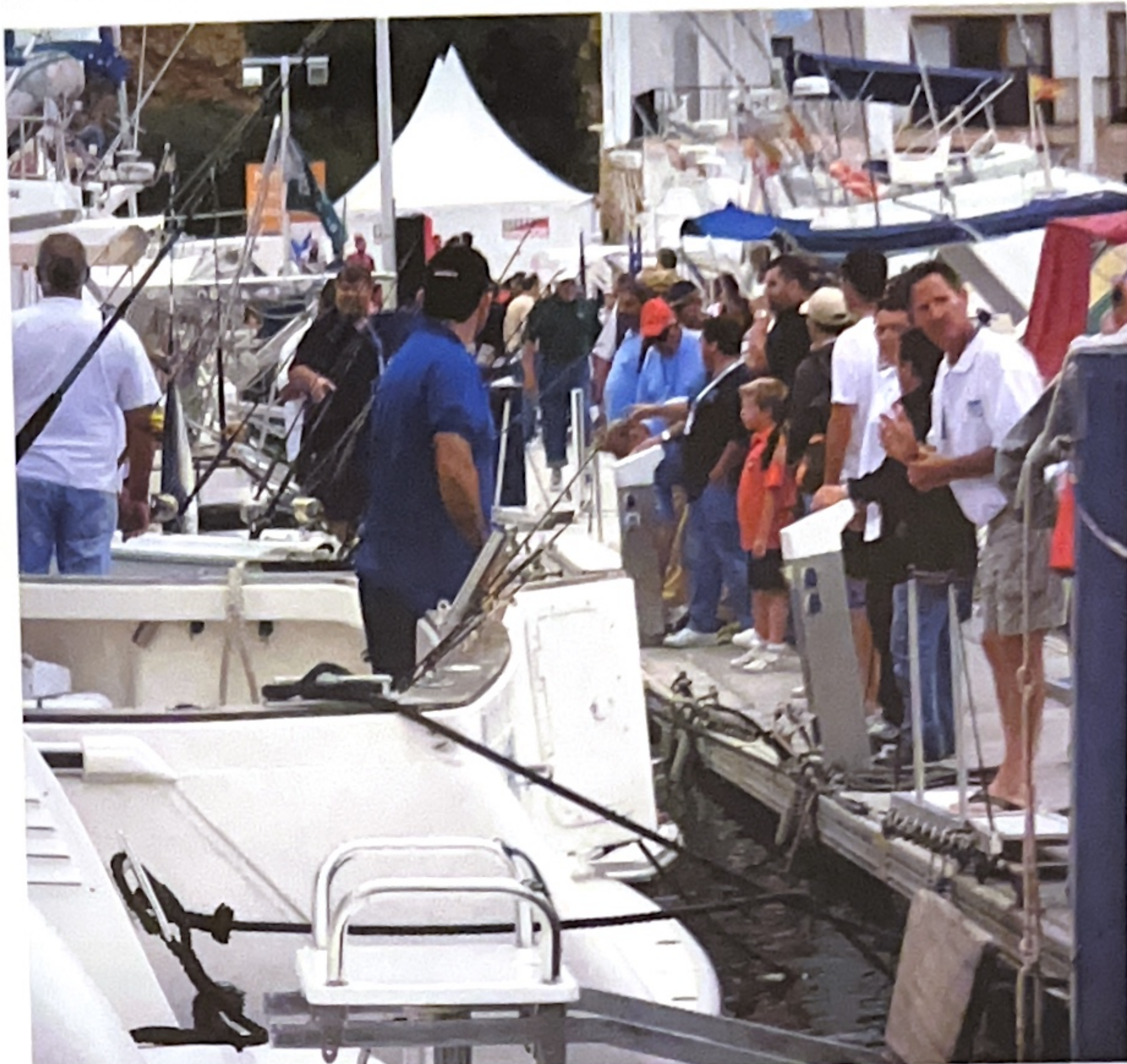
El evento generó mucha expectación.

A las 5.30 h, los equipos se reunieron en el club náutico para desayunar y, posteriormente, cada selección se embarcó, yendo hacia la bocana a esperar la señal de salida. La mayoría de los equipos se dirigieron hacia el sur, mientras que otros pocos tomaron rumbo a Ibiza, ya que habían llegado rumores de que los atuneros estaban faenando por la zona. Con el mar en calma y un sol radiante, por emisora se oían mensajes confusos de combates, que durante todo el día se repitieron, y que a la postre no fueron tantas capturas como parecían.