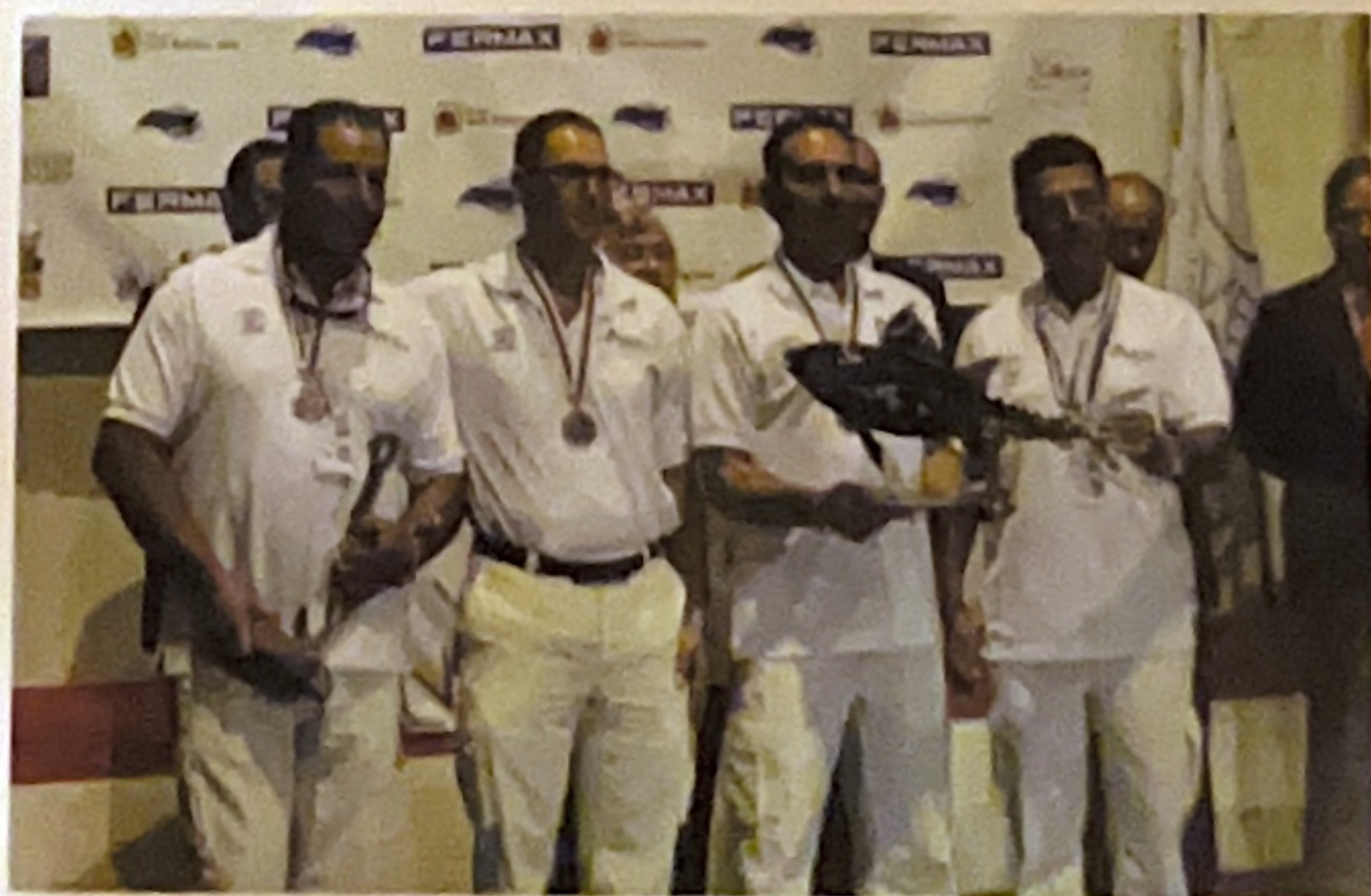
El equipo Club Mar Sport Arenys de Mar, campeón del mundo.