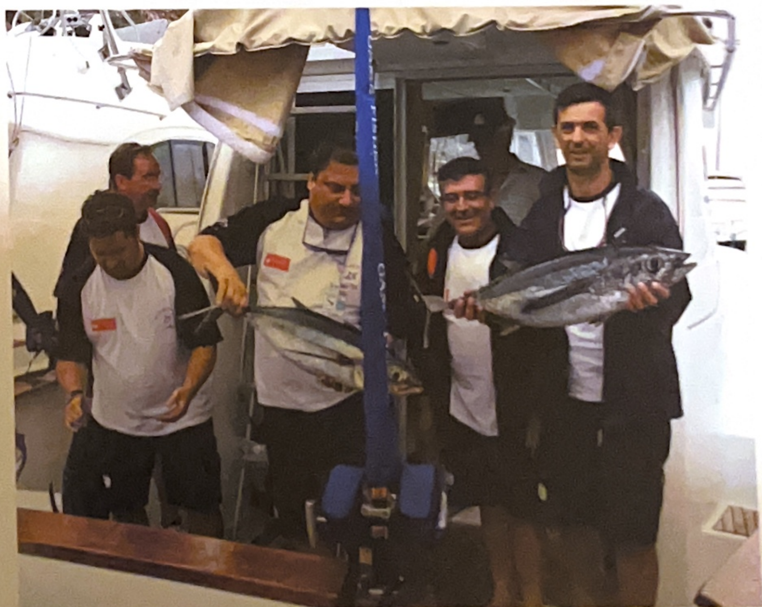
El Club de Pesca El Masnou quedó primero en la primera manga.

car líneas del agua, y se empezó a regresar hacia el puerto teniendo en cuenta que la hora máxima de llegada era las 18.30 h. Una vez en la zona de pesaje, en la primera manga quedó primero el Club de Pesca El Masnou (España D), con tres bonitas albacoras de 7,4, 8,5, y 6 kilos; el segundo, el